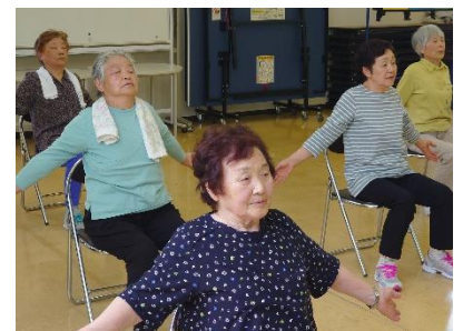
《令和6年度 活動の様子 書道教室（左）修学旅行（中央）健康体操教室（右）》