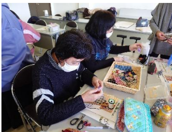
出来上がりを想像しながらチクチクチク

南洞先生の楽しいお話と香りに包まれながら、平泉と平安時代に思いを馳せるひと時となりました。