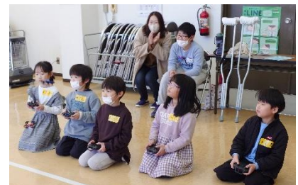
【実際に飛ばしてみよう】