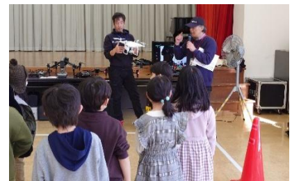
【ドローンの仕組みを学ぼう】

最後は3組に分かれてドローンを飛ばし、輪の中にドローンを通す「輪くぐりゲーム」を行い、決勝戦で的の近くに着陸させる「着陸ゲーム」を行いました。今後も活躍の場が広がっていくドローンを知る良い機会となりました。