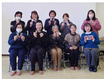
お気に入りの“香り袋”とはいチーズ